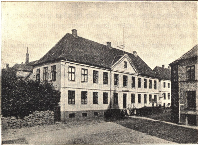
Billede af Katedralskolen i sin nuværende Skikkelse.

I Stueetagen blev de 4 Klasseværelser omregulerede, de nuværende Stuer A, B, C og D; der anbragtes en Gang ud til Mogensgade, hvorfra der blev Indgang til dem alle. — Det uheldigste — navnlig for fremtidige Udvidelser — var derimod Indretningen af Sidebygningen ud mod Nytorvsgrde . Her anbragtes en 5. Klasse