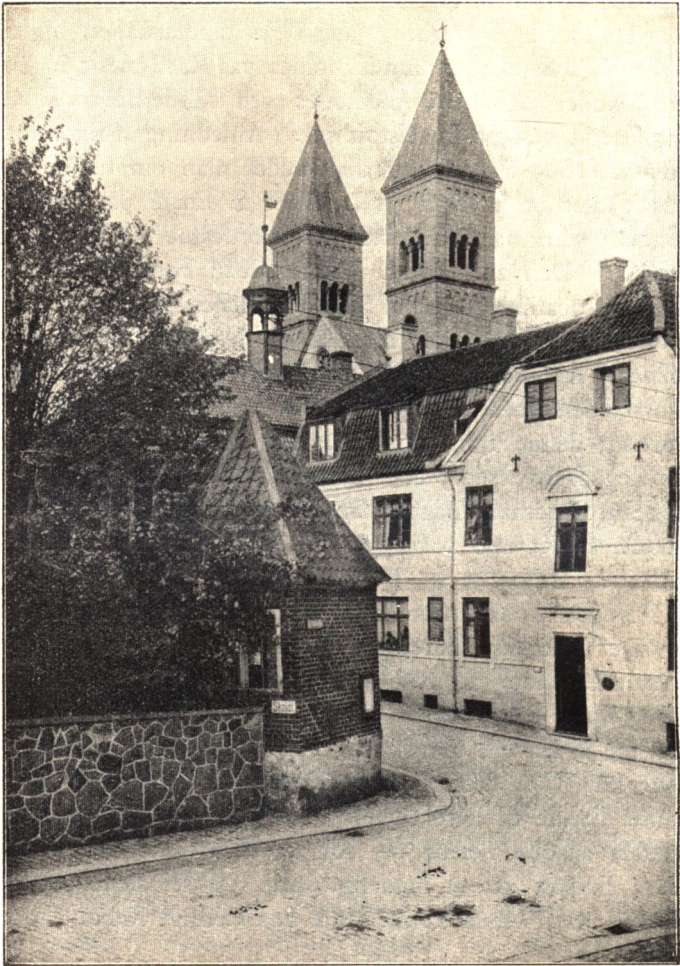
Billede af Lysthuset.

for Tiden bruger det Stykke af Haven, til uskyldig og nødvendig Rekreation«. Sagen kom dog ikke denne Gang i Orden; i al Fald købte Skolen det først i Oktbr. 1830