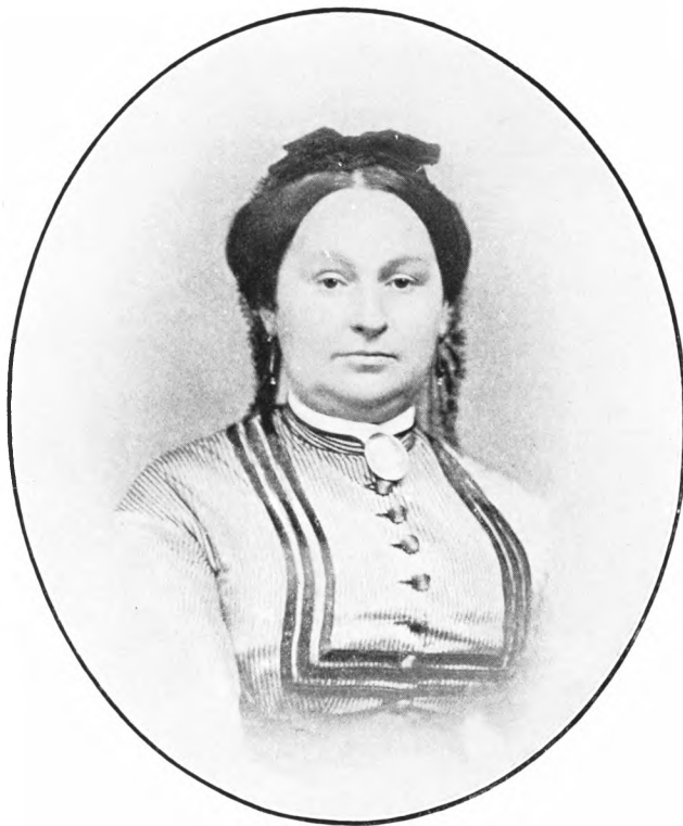
HELENE KALCKAR, f. HARTVIG 1822—1903