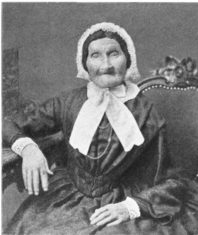
SARA LEVY, F. LEVIN 1772—1865