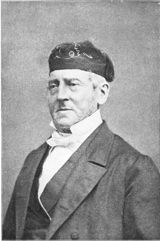
ELIAS ABRAHAMSEN 1800—1889