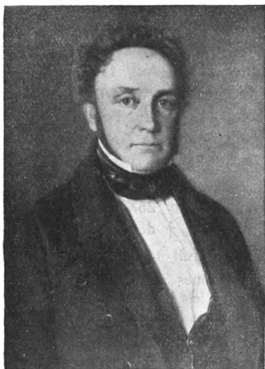
Otto Lindegaard, Etatsraad; 1792—1875.