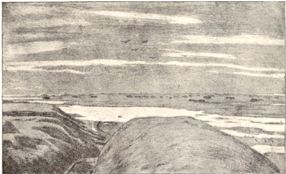
Harboøre set fra Engbjærg Bakker.