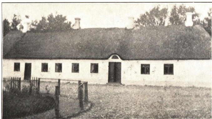
Ø. Havnstrup Stuehus. Bygget 1828.