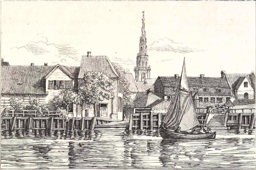
Dokken paa Christianshavn.