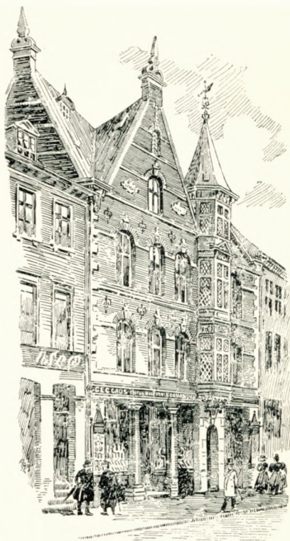
Den nye Ejendom i Vimmelskaftet.