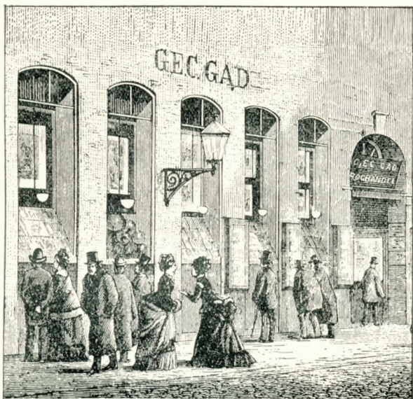
Den gamle Ejendom i Vimmelskaflet (Nr. 32, gl. Nr. 17).

af O. H. Delbanco, skiftede Navn den 1. Juli 1866. Den Dag udkom det for første Gang som Nordisk Boghandlertidende . Delbanco gav det et nordisk Præg ved ogsaa at lade det bringe norske og svenske Bogforteg-